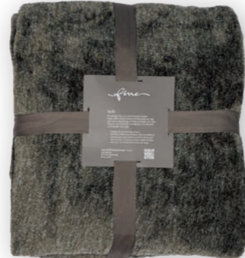
Melli 130 olive 140x200 cm · 55.1x78.7 in 100 % PES