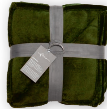
Soft Velvet 136 spring green 140x200 cm · 55.1x78.7 in 100% PES