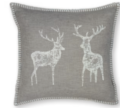
Naturliebe-1 141 nude-creme 2 50×50 cm · 19.7×19.7 in 58 % CO | 30 % LI | 12 % Lyocell Stickgarn | Embroid. yarn: 100 % PES