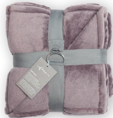
Soft Velvet 183 mauve 140x200 cm · 55.1x78.7 in 100% PES