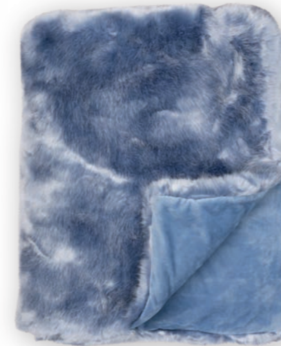
Luxe 181 arctic 140x190 cm · 55.1x74.8 in Fell | Fur: 90% PAN | 10% PES Rückseite | Reverse: 100% PES (Velboa)