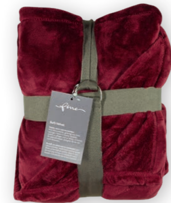
Soft Velvet 150 red 140x200 cm · 55.1x78.7 in 100% PES