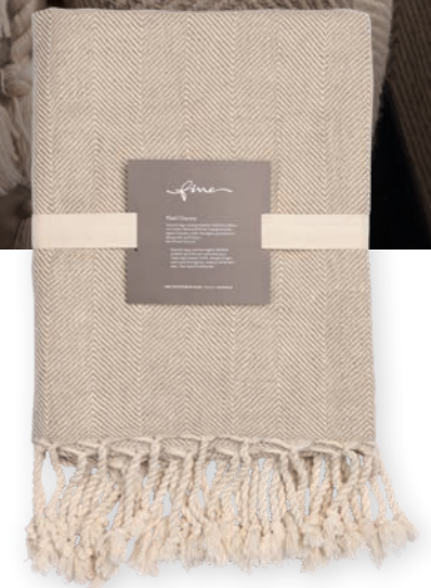
Gianna 110 linen 130x170 cm · 51,2x66,9 in 55% LI | 45% CO