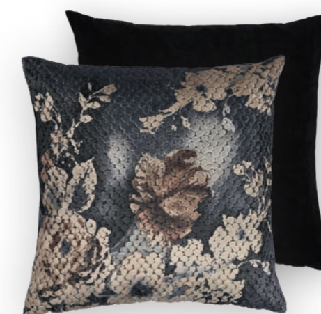
Bloom 180 50×50 cm · 19.7×19.7 in Vorderseite | Front: 54 % CV | 46 % PES Rückseite unifarben Nachtblau | Plain reverse Night Blue 100 % PES