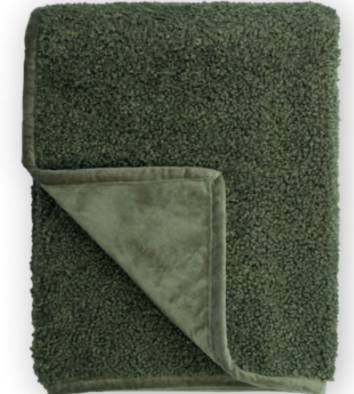
Curly 130 green 140x190 cm · 55.1x74.8 in Fell | Fur: 100% PES Rückseite | Reverse: 100% PES (Velboa)