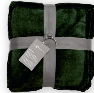
Soft Velvet 135 pine 140x200 cm · 55.1x78.7 in 100% PES