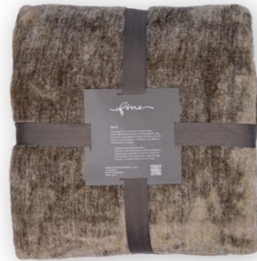
Melli 111 blonde 140x200 cm · 55.1x78.7 in 100 % PES