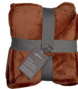
Soft Velvet 161 terracotta 140x200 cm · 55.1x78.7 in 100% PES