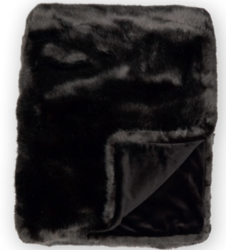
Luxe 140 mocca 140x190 cm · 55.1x74.8 in Fell | Fur: 90% PAN | 10% PES Rückseite | Reverse: 100% PES (Velboa)