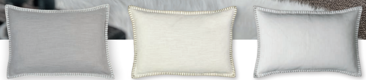
Modern Country-1 170 stone 1 60×40 cm · 23.6×15.7 in 75 % CV | 25 % LI Stickgarn | Embroid. yarn: 100 % PES