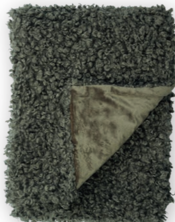
Puppy 130 forest

140×190 cm · 55.1×74.8 in Fell | Fur: 100% PES Rückseite | Reverse: 100% PES (Velboa)