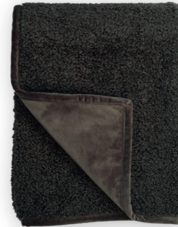
Curly 140 chocolate 140x190 cm · 55.1x74.8 in Fell | Fur: 100% PES Rückseite | Reverse: 100% PES (Velboa)