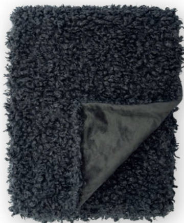
Puppy 170 anthrazit

140×190 cm · 55.1×74.8 in Fell | Fur: 100% PES Rückseite | Reverse: 100% PES (Velboa)