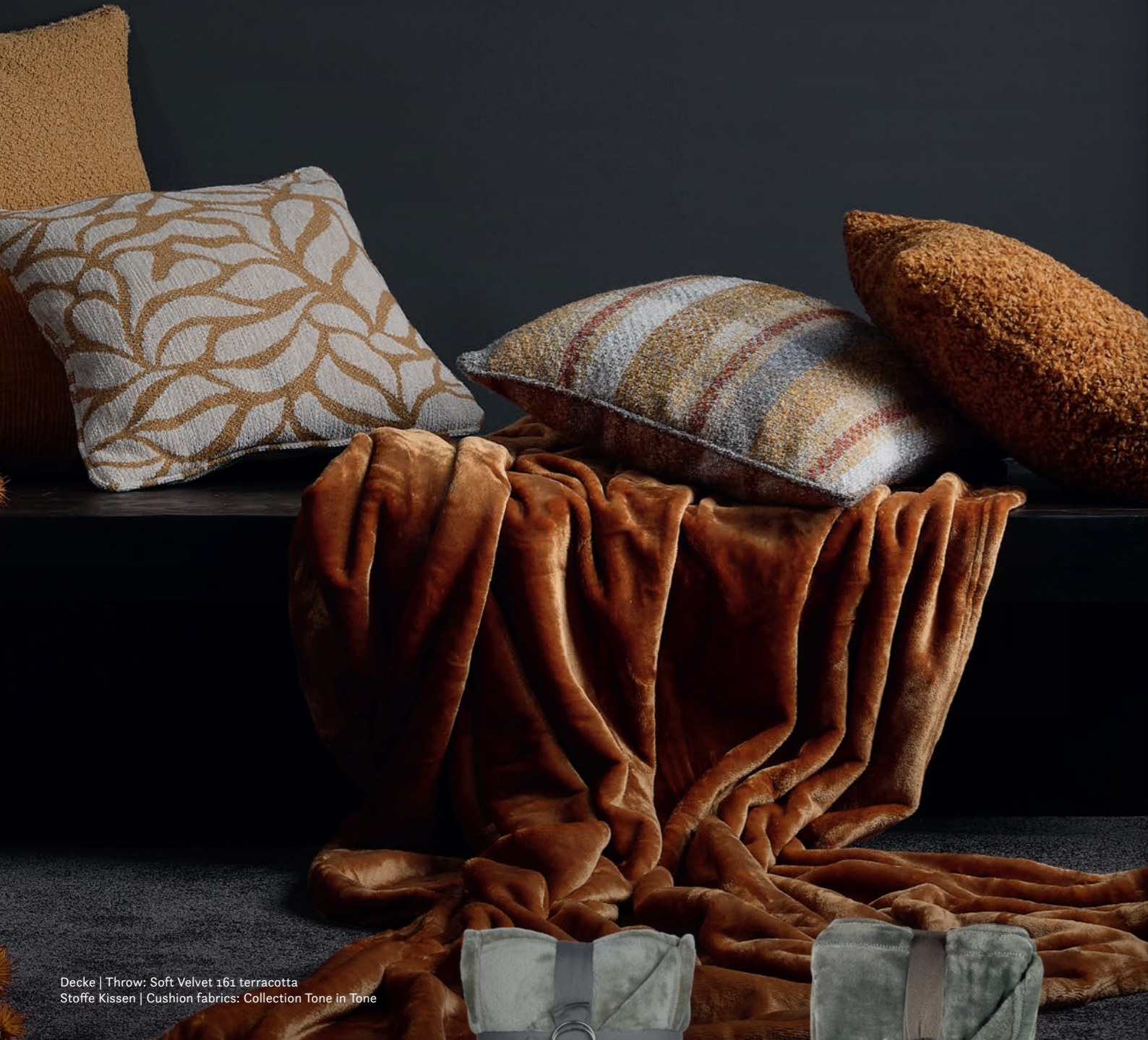
Decke | Throw: Soft Velvet 161 terracotta Stoffe Kissen | Cushion fabrics: Collection Tone in Tone

High pile velour throw made from high quality fibres and available in many colours including lots of natural tones, some stronger and a few muted colours. Washable.