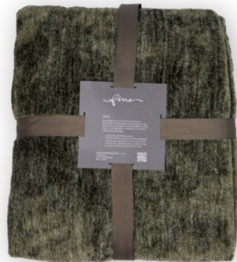
Melli 131 green 140x200 cm · 55.1x78.7 in 100 % PES