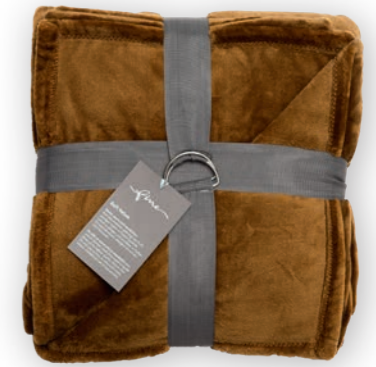
Soft Velvet 162 caramel 140x200 cm · 55.1x78.7 in 100% PES