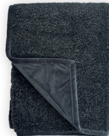
Curly 170 grafite 140x190 cm · 55.1x74.8 in Fell | Fur: 100% PES Rückseite | Reverse: 100% PES (Velboa)