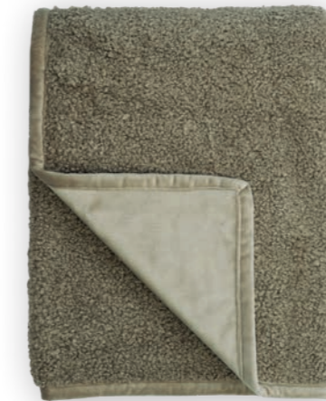
Curly 111 taupe 140x190 cm · 55.1x74.8 in Fell | Fur: 100% PES Rückseite | Reverse: 100% PES (Velboa)