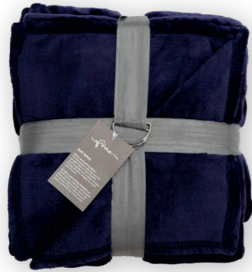
Soft Velvet 187 dark violet 140x200 cm · 55.1x78.7 in 100% PES