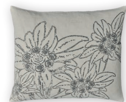
Bergsommer 170 sand-anthracite 3 60×50 cm · 23.6×19.7 in 100 % LI Stickgarn | Embroid. yarn: 100 % PES