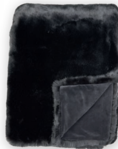
Luxe 171 graphit 140x190 cm · 55.1x74.8 in Fell | Fur: 90% PAN | 10% PES Rückseite | Reverse: 100% PES (Velboa)