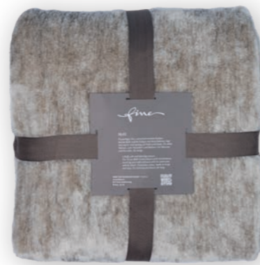
Melli 110 beige 140x200 cm · 55.1x78.7 in 100 % PES