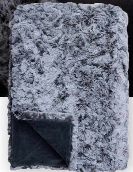
Vivace 170 anthracite

140x190 cm · 55.1x74.8 in Fell | Fur: 100% PES Rückseite | Reverse: 100% PES (Velboa)