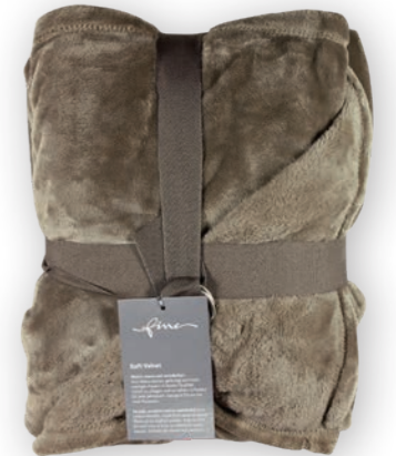
Soft Velvet 112 taupe 140x200 cm · 55.1x78.7 in 100% PES