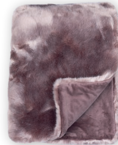
Luxe 151 rosewood 140x190 cm · 55.1x74.8 in Fell | Fur: 90% PAN | 10% PES Rückseite | Reverse: 100% PES (Velboa)