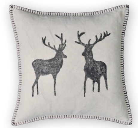
Naturliebe 112 sand-anthracite 3 60×60 cm · 23.6×23.6 in 100 % LI Stickgarn | Embroid. yarn: 100 % PES

Die Kissen werden ohne Füllung geliefert. | The cushions are delivered without filling. Die Abbildungen sind nicht farbverbindlich. | The colours of the illustrations may vary. Solange der Vorrat reicht. | While stock lasts. Verpackungseinheit 2 Stück. | Packaging unit 2 pieces. Für Kissen gilt eine Mindestbestellmenge von 4 Stück. Sie können aus allen Kollektionen nach Belieben mischen. | Minimum ordering quantity of 4 pieces for cushions. You can mix cushions from all collections.