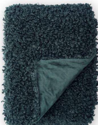
Puppy 131 petrol

140×190 cm · 55.1×74.8 in Fell | Fur: 100% PES Rückseite | Reverse: 100% PES (Velboa)