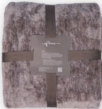
Melli 180 lavender 140x200 cm · 55.1x78.7 in 100 % PES