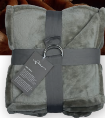
Soft Velvet 133 cottage green 140x200 cm · 55.1x78.7 in 100% PES