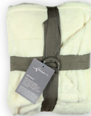
Soft Velvet 110 off-white 140x200 cm · 55.1x78.7 in 100% PES