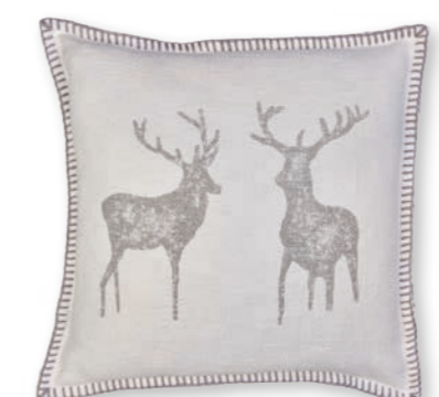
Naturliebe-1 112 creme-grey 2 50×50 cm · 19.7×19.7 in 58 % CO | 30 % LI | 12 % Lyocell Stickgarn | Embroid. yarn: 100 % PES