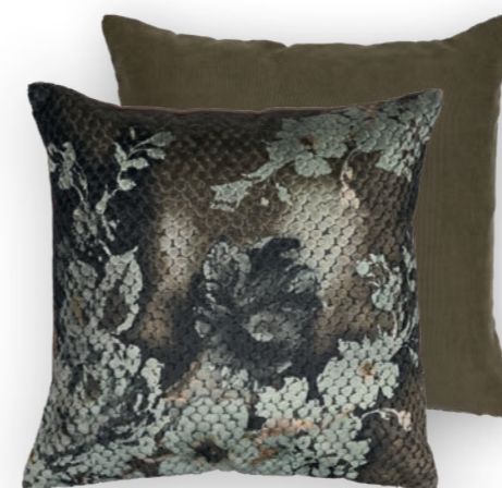
Bloom 130 50×50 cm · 19.7×19.7 in Vorderseite | Front: 54 % CV | 46 % PES Rückseite unifarben | Plain reverse Olive 100 % PES