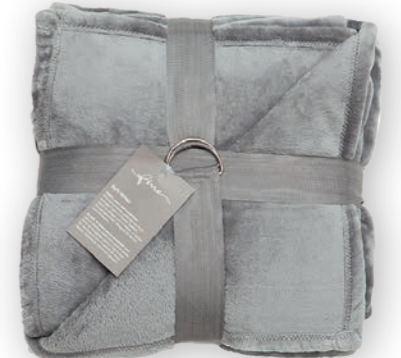
Soft Velvet 142 stone 140x200 cm · 55.1x78.7 in 100% PES