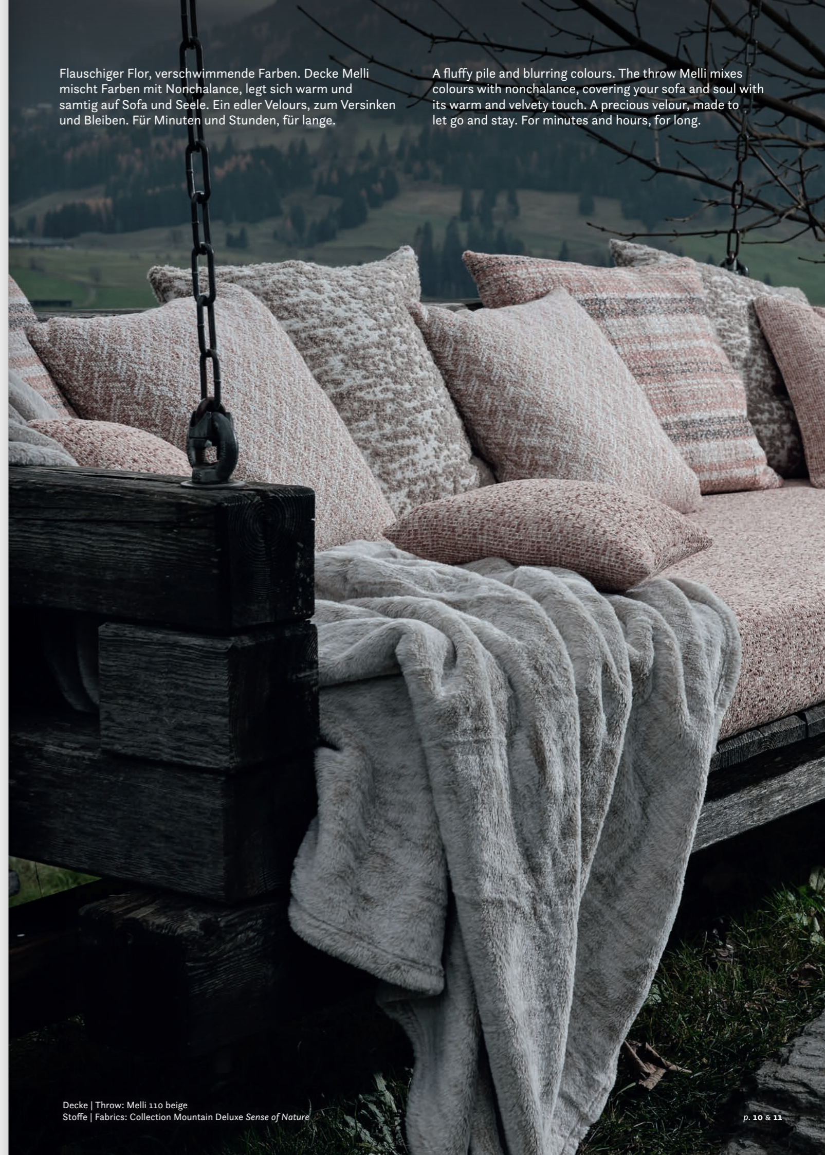
Decke | Throw: Melli 110 beige Stoffe | Fabrics: Collection Mountain Deluxe Sense of Nature

A fluffy pile and blurring colours. The throw Melli mixes colours with nonchalance, covering your sofa and soul with its warm and velvety touch. A precious velour, made to let go and stay. For minutes and hours, for long.