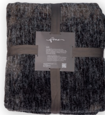
Melli 141 brown 140x200 cm · 55.1x78.7 in 100 % PES