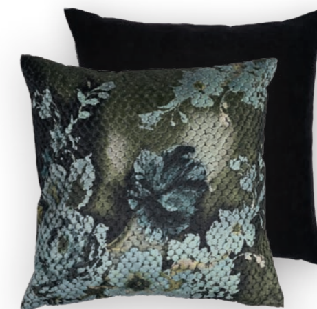
Bloom 131 50×50 cm · 19.7×19.7 in Vorderseite | Front: 54 % CV | 46 % PES Rückseite unifarben Nachtblau | Plain reverse Night Blue 100 % PES