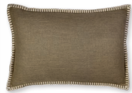
Modern Country-1 140 cognac 1 60×40 cm · 23.6×15.7 in 75 % CV | 25 % LI Stickgarn | Embroid. yarn: 100 % PES