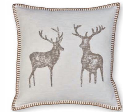
Naturliebe-1 111 creme-cognac 2 50×50 cm · 19.7×19.7 in 58 % CO | 30 % LI | 12 % Lyocell Stickgarn | Embroid. yarn: 100 % PES