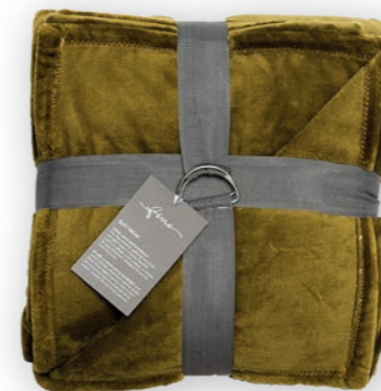
Soft Velvet 120 curry 140x200 cm · 55.1x78.7 in 100% PES