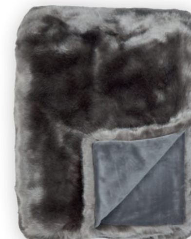
Luxe 141 taupe 140x190 cm · 55.1x74.8 in Fell | Fur: 90% PAN | 10% PES Rückseite | Reverse: 100% PES (Velboa)