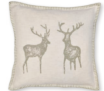
Naturliebe-1 110 beige-khaki 2 50×50 cm · 19.7×19.7 in 58 % CO | 30 % LI | 12 % Lyocell Stickgarn | Embroid. yarn: 100 % PES