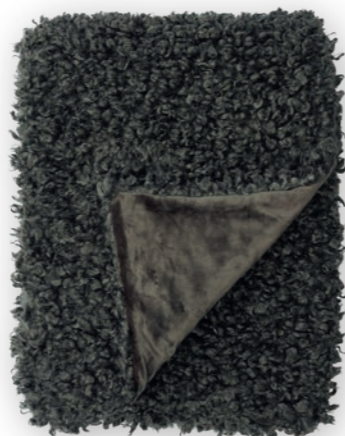
Puppy 141 brown

140×190 cm · 55.1×74.8 in Fell | Fur: 100% PES Rückseite | Reverse: 100% PES (Velboa)