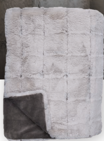
Quadro 141 taupe

140x190 cm · 55.1x74.8 in Fell | Fur: 100% PES Rückseite | Reverse: 100% PES (Velboa)