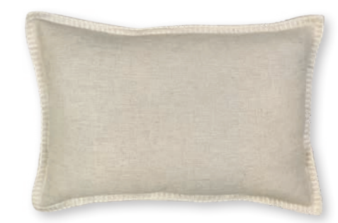
Modern Country-1 110 nature 1 60×40 cm · 23.6×15.7 in 75 % CV | 25 % LI Stickgarn | Embroid. yarn: 100 % PES