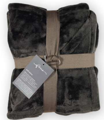
Soft Velvet 171 black 140x200 cm · 55.1x78.7 in 100% PES