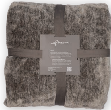
Melli 140 taupe 140x200 cm · 55.1x78.7 in 100 % PES