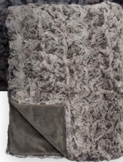
Vivace 140 brown

Webpelzdecke | Faux Fur throw: Vivace 170 anthracite