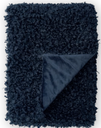
Puppy 181 denim

140×190 cm · 55.1×74.8 in Fell | Fur: 100% PES Rückseite | Reverse: 100% PES (Velboa)