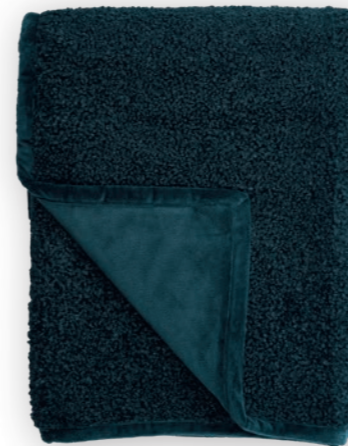
Curly 180 petrol 140x190 cm · 55.1x74.8 in Fell | Fur: 100% PES Rückseite | Reverse: 100% PES (Velboa)