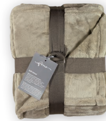
Soft Velvet 111 beige 140x200 cm · 55.1x78.7 in 100% PES