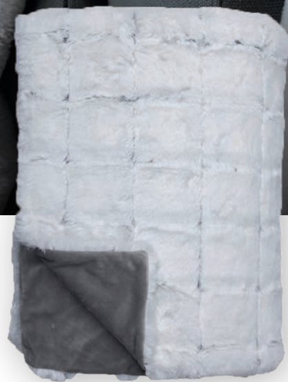
Quadro 110 white

Webpelzdecke | Faux Fur throw: Quadro 110 white