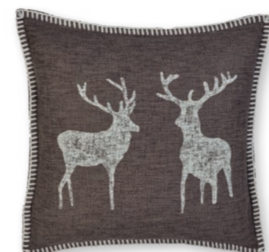
Naturliebe-1 140 brown-creme 2 50×50 cm · 19.7×19.7 in 58 % CO | 30 % LI | 12 % Lyocell Stickgarn | Embroid. yarn: 100 % PES