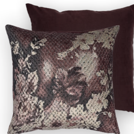
Bloom 150 50×50 cm · 19.7×19.7 in Vorderseite | Front: 54 % CV | 46 % PES Rückseite unifarben | Plain reverse Aubergine 100 % PES