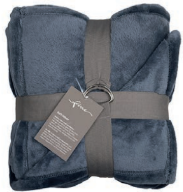
Soft Velvet 186 petrol 140x200 cm · 55.1x78.7 in 100% PES