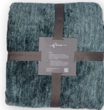
Melli 181 petrol 140x200 cm · 55.1x78.7 in 100 % PES