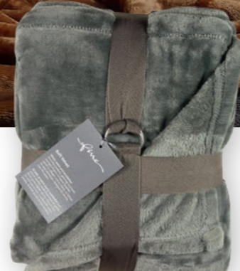
Soft Velvet 170 grey 140x200 cm · 55.1x78.7 in 100% PES