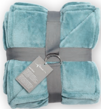
Soft Velvet 184 paleblue 140x200 cm · 55.1x78.7 in 100% PES