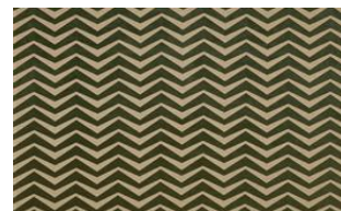
Zig Zag 030