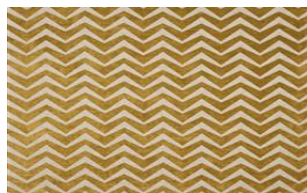
Zig Zag 020