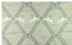
Sonnwend 019 *