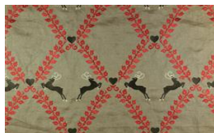
Sonnwend 049 *

* eingeschränkte Verfügbarkeit – bitte um Rücksprache mit unserem Verkaufsteam