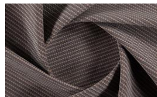
Softly Dot o40