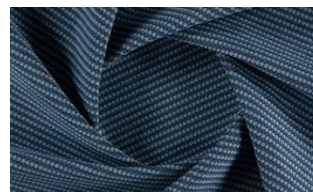
Softly Dot o82