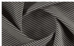
Softly Dot o81