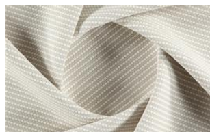
Softly Dot o10