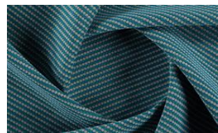
Softly Dot o80