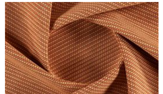
Softly Dot 060