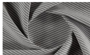
Softly Dot 070