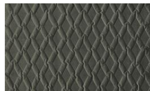
Luca Rhomb 041