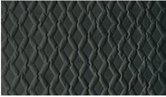
Luca Rhomb 070