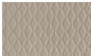
Luca Rhomb 010