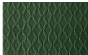
Luca Rhomb 030