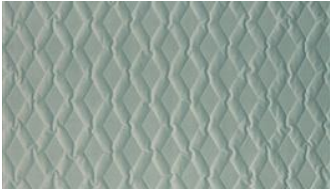
Luca Rhomb o80