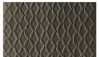
Luca Rhomb 040