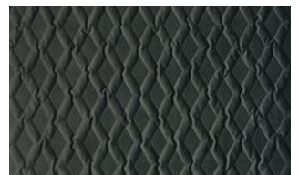
Luca Rhomb 070