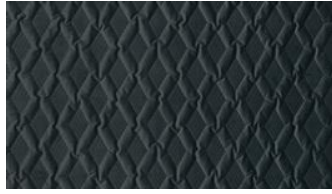
Luca Rhomb o81