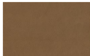
Little Joe 040