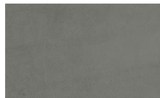
Little Joe 071