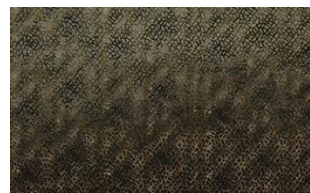
Cheeky o39 °