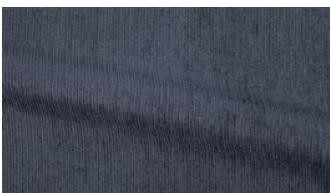
Be Fine 081