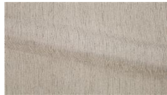
Be Fine 072