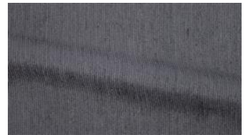
Be Fine 080