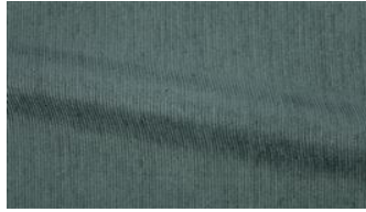
Be Fine 031