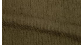
Be Fine 032