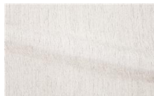
Be Fine 012