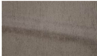
Be Fine 041