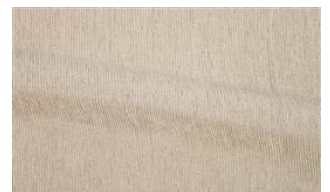
Be Fine 013