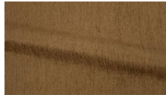
Be Fine 042