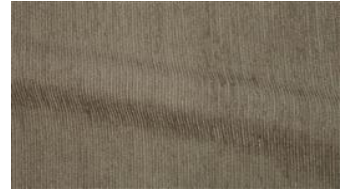
Be Fine 033