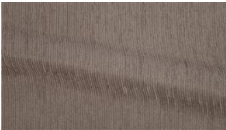
Be Fine 040