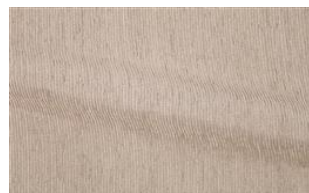
Be Fine 010