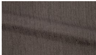
Be Fine 071