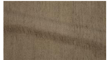
Be Fine 043