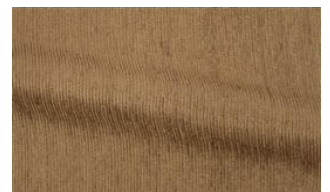
Be Fine 020