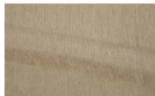
Be Fine 014