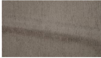
Be Fine 041