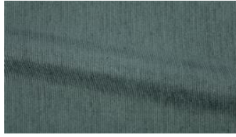
Be Fine 031