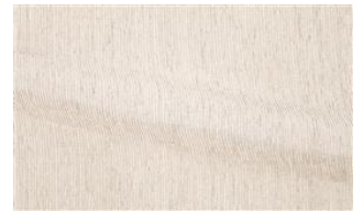
Be Fine 011