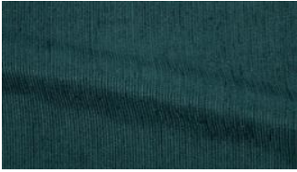
Be Fine 030