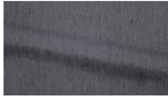
Be Fine 080