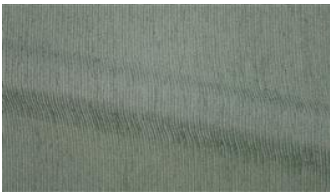
Be Fine 082