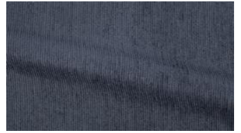
Be Fine 081