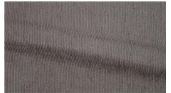
Be Fine 070